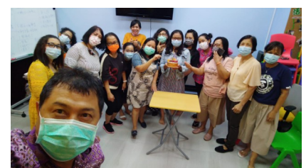
Suasana Ibadah Minggu 7 Juni 2020